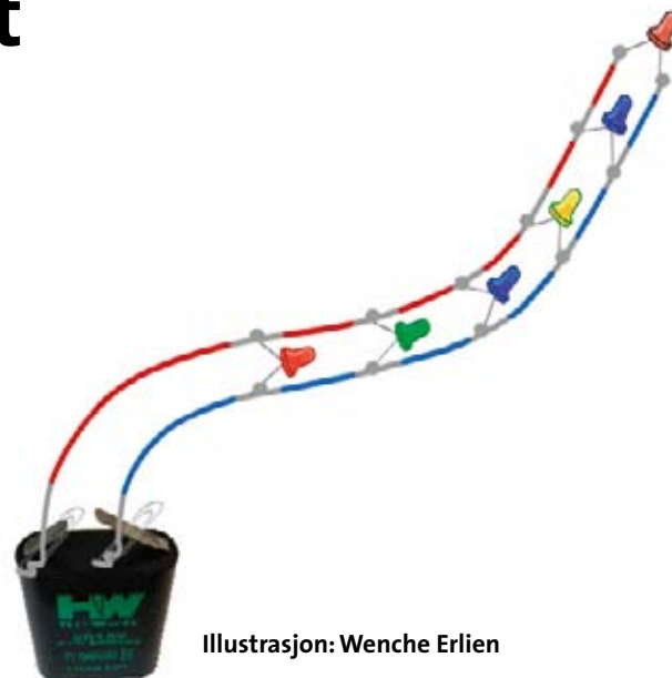
Illustrasjon: Wenche Erlen

Batteriet bør ligge på utsiden av pepperkakehuset, slik at lyset kan slås av og på. Ledningene med lys går under veggen og kveiles rundt på innsiden av huset.